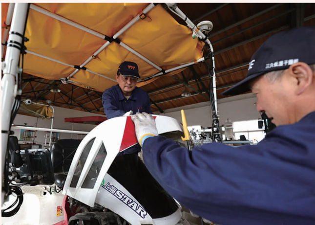
2月22日,农机维保师在松江小昆山镇冠军农机互助点保养拖拉机。图为对5G穴播机进行保养。