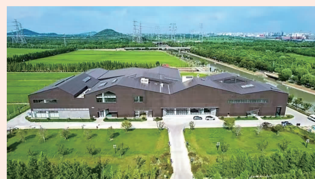
小昆山大米加工厂荣获“工业旅游服务新达标单位”称号。